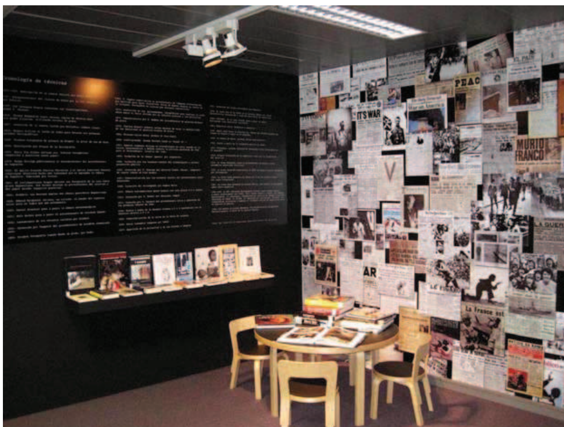
Imagen 4. Exposición: Fotoperiodismo

Acompañando a la exposición, se amplía esta información con documentales, entrevistas, bibliografía, fotógrafos pioneros en Vitoria-Gasteiz y recursos web sobre fotoperiodistas actuales, agencias, bancos de imágenes, premios, etc, entre otros temas.