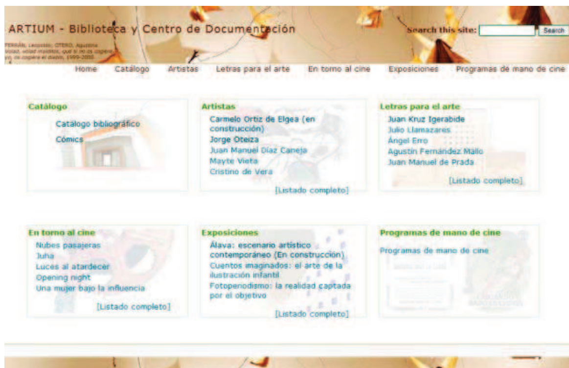
Imagen 1. Portada del gestor de contenidos

Los contenidos los hemos estructurando del siguiente modo: