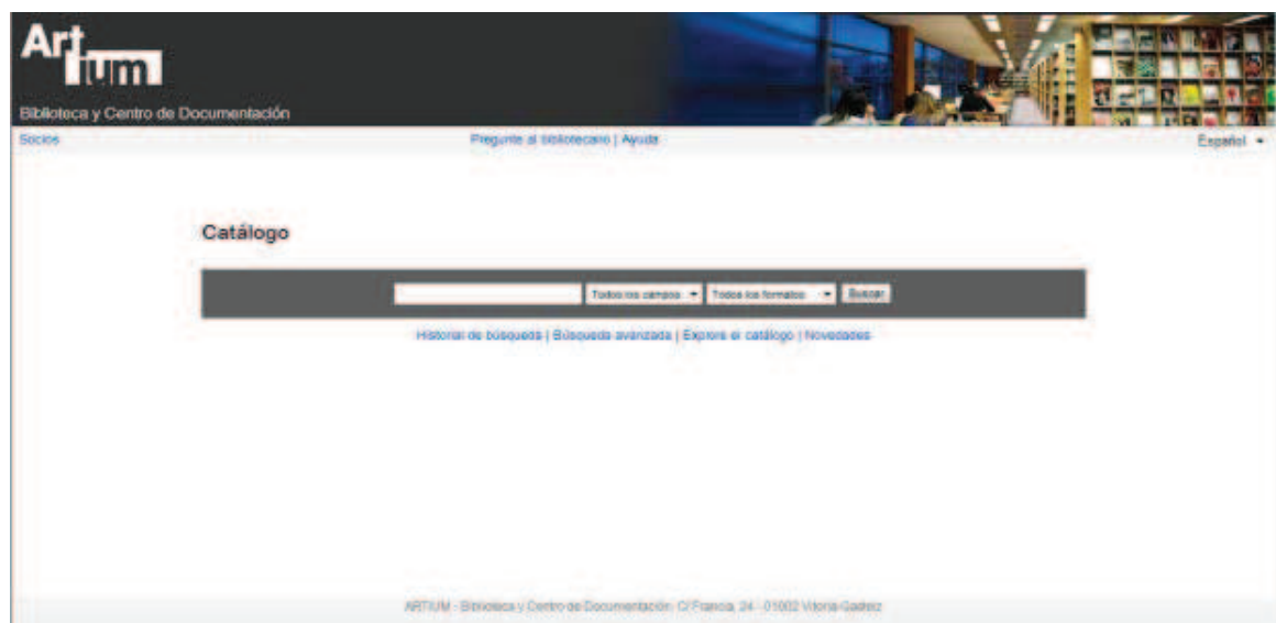
Imagen 2. Catálogo bibliográfico

Artistas. Se ofrece acceso a toda la documentación que desde el centro se está generando sobre distintos artistas contemporáneos. Se puede consultar la biografía del artista, su obra, exposiciones, exposiciones en Artium, bibliografía general, bibliografía presente en la biblioteca del museo y recursos electrónicos.