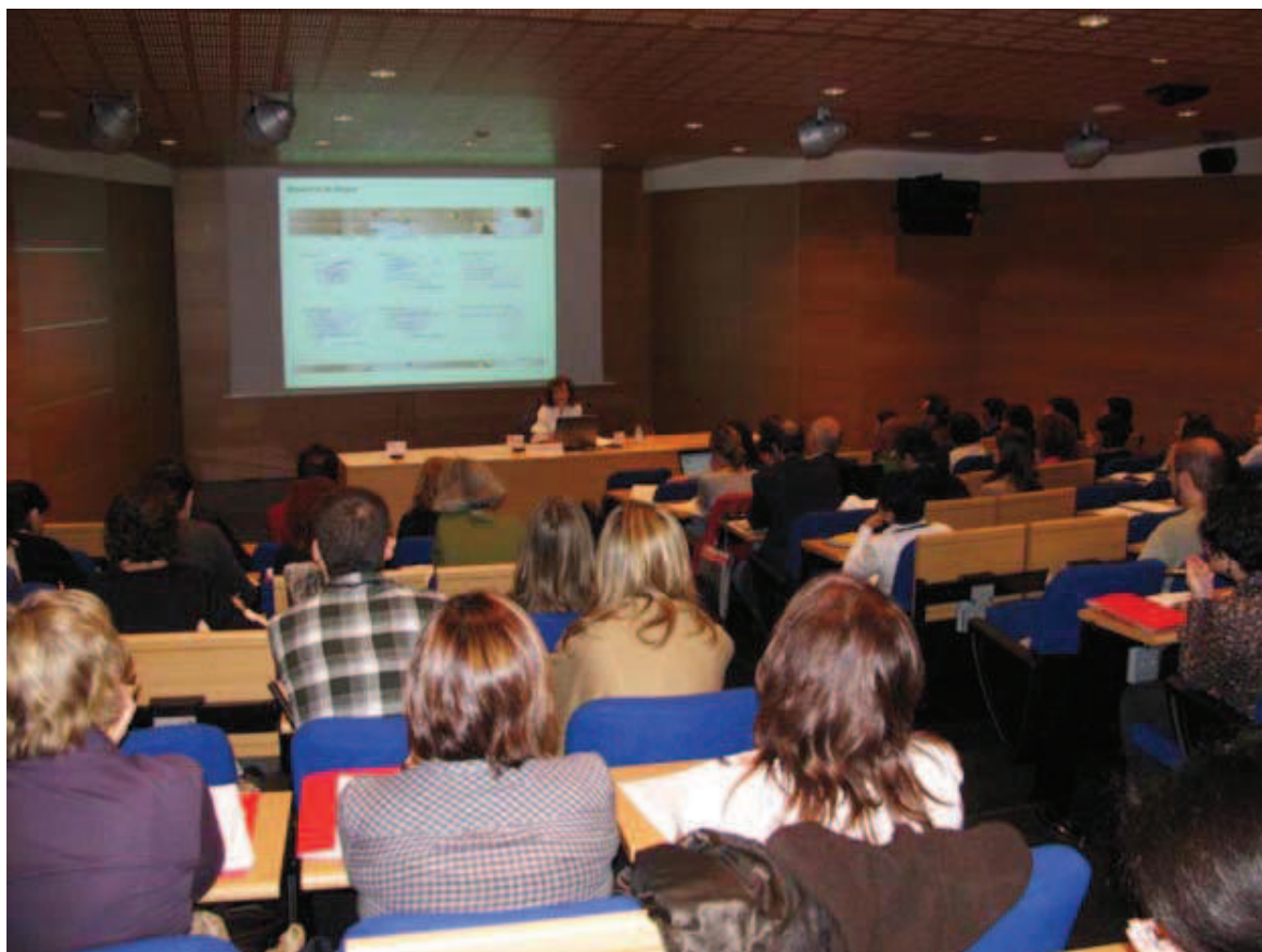
Imagen 6. V Encuentros de Centros de Documentación

de Documentación referidos al apoyo y promoción de trabajos de investigación y difusión del estudio de la producción artística contemporánea, se convoca con carácter bienal esta beca de investigación. Mediante dicha convocatoria la biblioteca pretende llegar a los jóvenes investigadores y hacerles partícipes de nuestro proyecto.