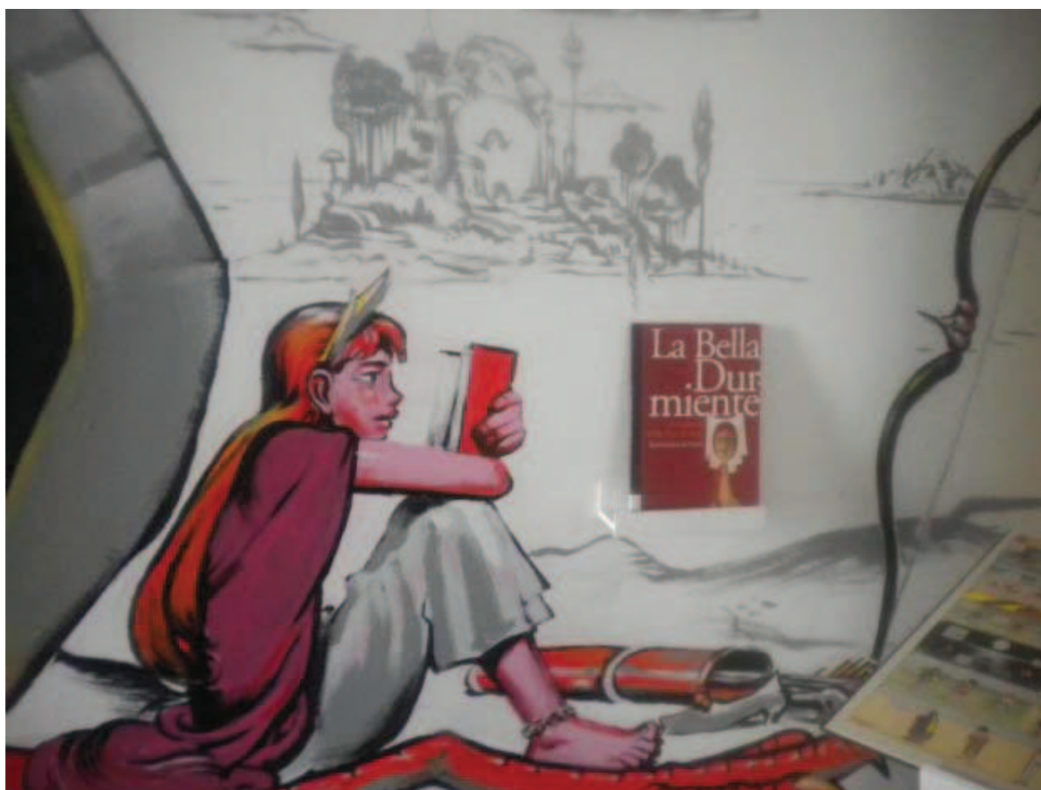
Imagen 5. Exposición: Cuentos imaginados

En la exposición se muestra una amplia selección de libros infantiles y juveniles a partir de los mejores ilustradores de la historia. Además, se acompaña de manuales sobre teoría y técnica de la ilustración, guías de ilustradores, revistas de ilustración y películas inspiradas en los cuentos originales.