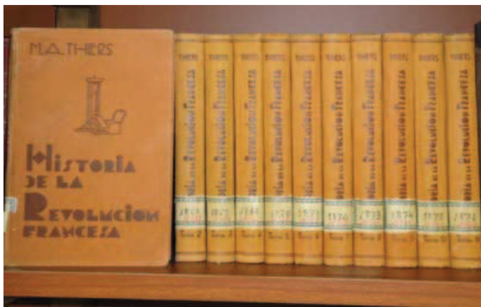
Historia de la Revolución Francesa [xlii]

se llevado a cabo un asalto a la biblioteca, que recordemos, se encontraba en el vestíbulo del ayuntamiento, habría quedado constancia documental del suceso. Segunda y no menos importante: la mayoría de los libros, que en aquel tiempo llenaban las estanterías de la biblioteca pública municipal existen actualmente, y se conservan en buen estado, en el fondo antiguo de las dependencias anexas del Archivo Histórico Municipal de Archidona. Por lo tanto, aquella negativa a donar libros para el Liceo Andaluz de Madrid, no respondía a los verdaderos motivos, como ejemplo, la Historia de la Revolución Francesa , adquirida en 1933.