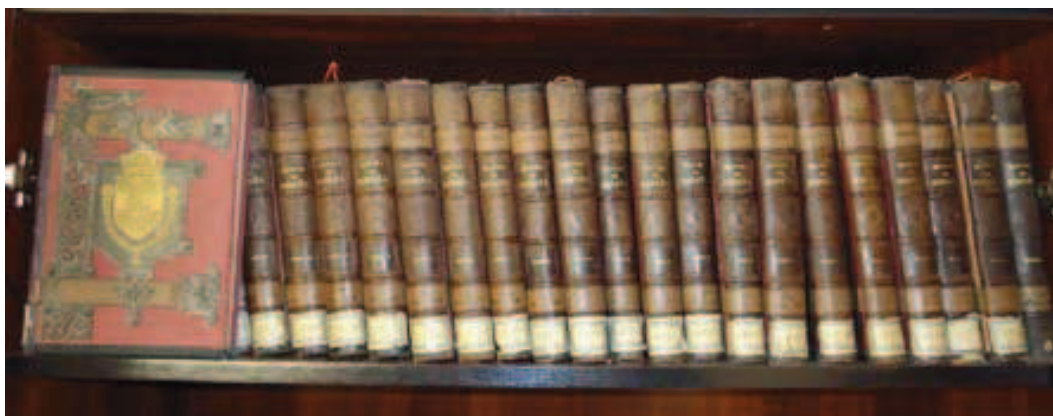
Historia General de España de Modesto Lafuente [xlviii]

A continuación y a propuesta del Sr. Alcalde se acordó adquirir de D a Esperanza Licerias Salazar una obra que posee de Historia de España con veinticinco tomos, lujosamente encuadernada, siendo su autor Modesto Lafuente, por lo que solicita se le abone la cantidad de ciento treinta y cinco pesetas que le serán libradas a la presentación de la factura y con cargo a la consignación correspondiente [xlvii].