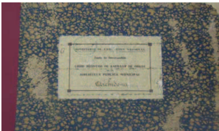
Libro de Registro de Entrada de Obras de la Biblioteca Pública de Archidona. 1949 [cii]

La Presidencia da cuenta de la inauguración y bendición de la Biblioteca Municipal con asistencia de miembros del Ilustre Ayuntamiento, de la Junta de dicha biblioteca y de público en general, quedando inaugurada la misma, manifestando que ha sido necesario adquirir seis sillones y una mesa para uso de los lectores; acordándose por unanimidad, conste en acta dicha inauguración que constituye un jalón para la cultura e historia local, cristalizando las iniciativas de la Alcaldía-Presidencia para conseguirla, y se pague del capítulo de mobiliario los seis sillones y la mesa al servicio de la Biblioteca [ci].