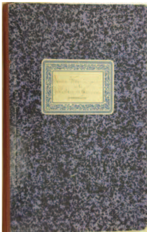
“Libro de Actas de la Junta Municipal de la Biblioteca”. 1949 [xcvii]