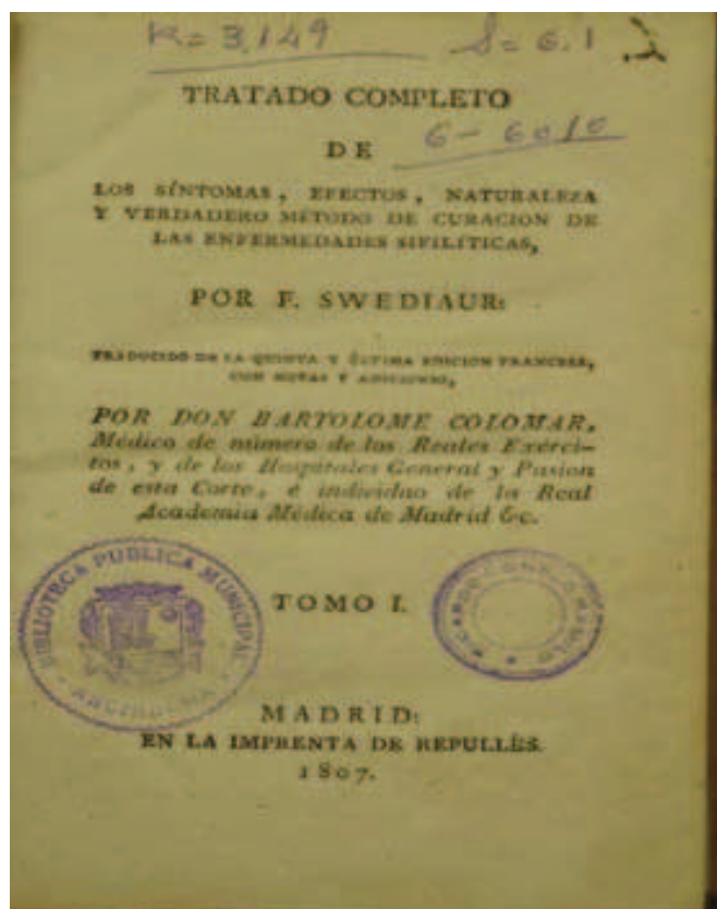
“ Tratado Completo de los Síntomas, Efectos, Naturaleza y Verdadero Método de Curación de las Enfermedades Sifilíticas ”. 1807 [civ]

Además de estos libros adquiridos mediante compra, se encuentran en la biblioteca otros libros que durante años fueron donados por parte de ciudadanos, tanto archidoneses como de otros lugares. Este aporte bibliográfico sigue siendo a día de hoy muy importante. Desde estas líneas queremos agradecer la generosidad de los donantes que tanto ayuda y engrandece nuestra biblioteca.