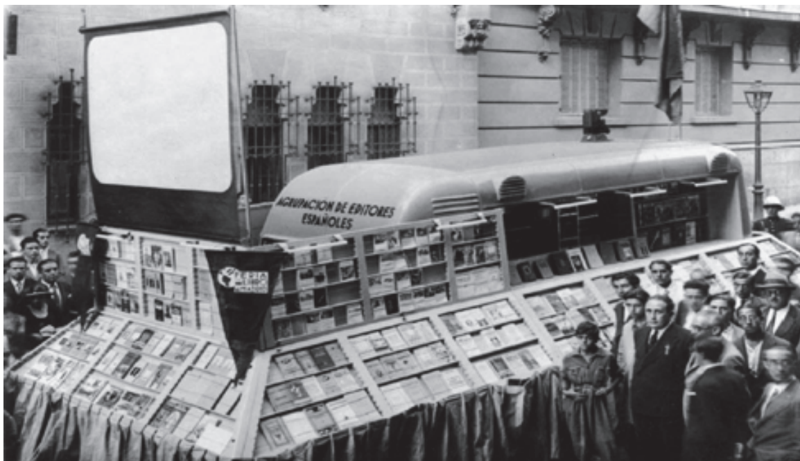
Camión-Stand antes de su primer recorrido por Extremadura. 26 septiembre 1934 [xxxii]

A continuación se expone una tabla [xxxiii] con la relación de pueblos visitados por el camión Stand en la provincia de Málaga, la cantidad de libros vendidos y donados por la Agrupación de Editores. Insistimos en que esta actividad es independiente a las Misiones Pedagógicas.