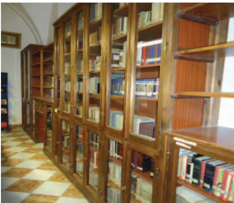
Estanterías donde actualmente se conserva parte del fondo antiguo [ciii]