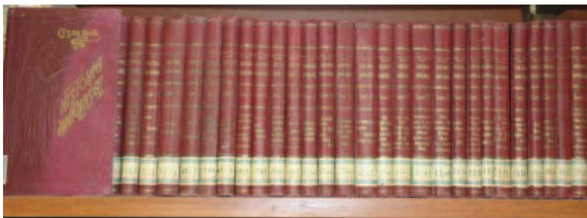
“ Historia Universal ” de Cesar Cantú [xxvi]

es circulante en su designación, pues los libros no podrán salir del edificio. Segundo: se hace responsable de la gestión de las consultas al portero del Ayuntamiento cuyo nombre era Juan Toro Montenegro [xxiv]. El Ayuntamiento en estas fechas estaba situado en calle Carrera número 1, sede actual de la Biblioteca Pública Municipal. Tercero: existe el contrato de la compra de los 453 volúmenes con destino a la biblioteca como una relación detallada de los mismos, bastantes de los cuales se conservan aún en perfecto estado, en el fondo antiguo que se conserva en las dependencias anexas del Archivo Histórico Municipal, antigua Biblioteca Pública Municipal. Algunos de esos títulos más representativos son: Historia de la Revolución Francesa de 12 tomos, Biblioteca Universal de 180 tomos, Historia Universal , Cantú de 43 tomos o Ciencias Exactas, Física y Química de 16 tomos [xxv]. Sin duda alguna, una extraordinaria compra para comenzar la andadura de una biblioteca.