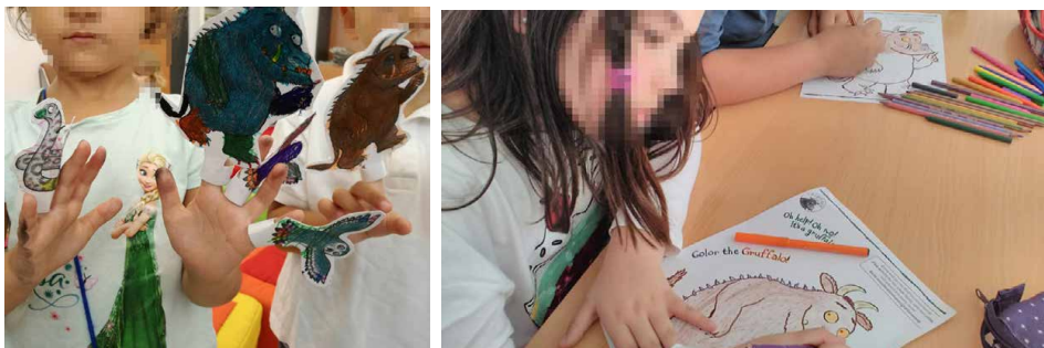
Imágenes 5 y 6

Alumnos/as de colegios de Sanlúcar de Barrameda llevando a cabo las actividades planteadas en la caja, tras la narración del cuento. Algunas cajas permiten también trabajar otros idiomas