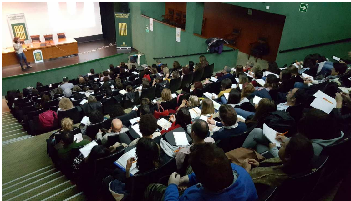
AFORO COMPLETO EN GRANADA