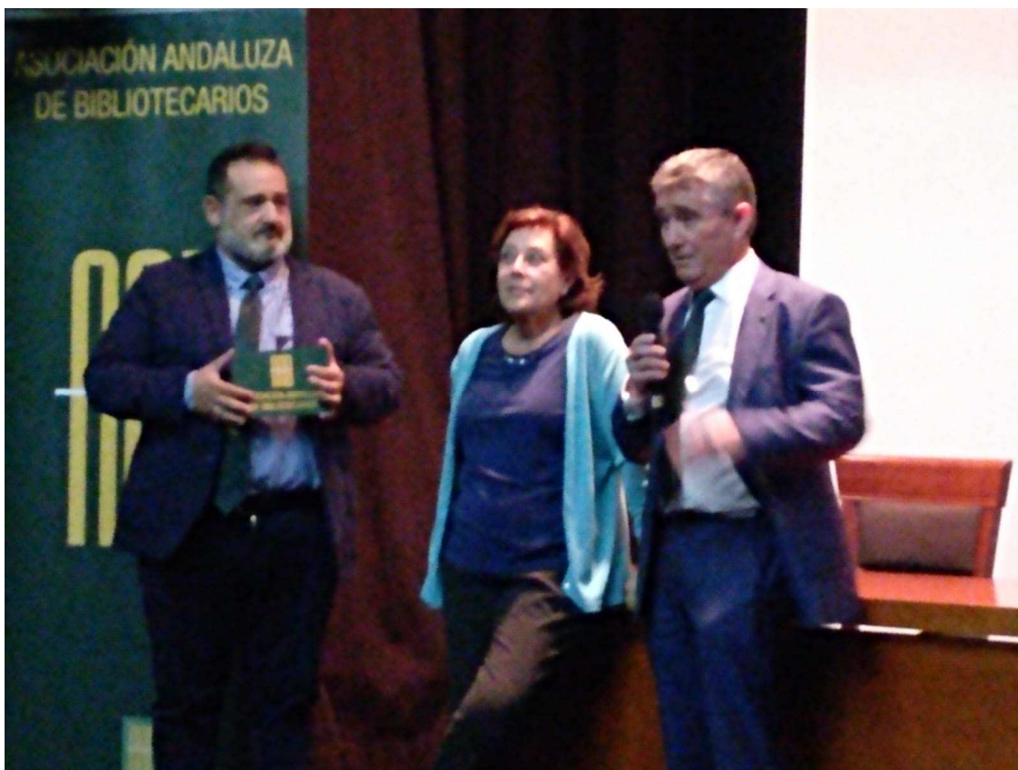
INAUGURACIÓN EN GRANADA