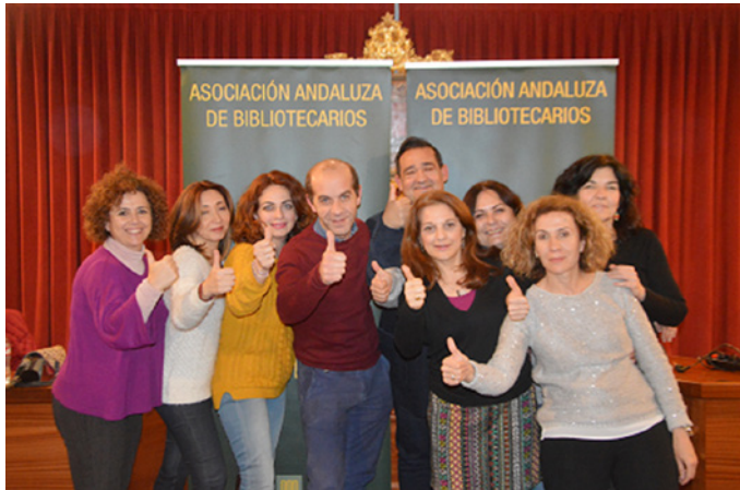
Miembros de la Comisión Directiva

El día 10 de marzo tuvo lugar en Archidona el “VI Encuentro Profesional de los Bibliotecarios Andaluces con la AAB”. En el Boletín 115 se publicará la crónica del Encuentro, así como los informes de los Grupos de Trabajo/Áreas de Trabajo.