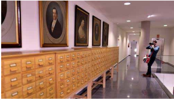
Una de las instalaciones de la biblioteca.