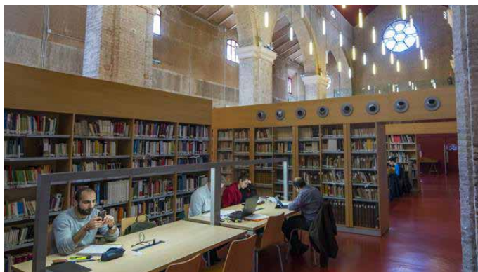
Una de las salas de lectura de Santa Lucía

Santa Lucía, desacralizada en el siglo XIX, alberga los archivos del Círculo Mágico de Sevilla. El Fondo Andaluz de Ilusionismo es el tercero del país en libros y el primero en vídeos.