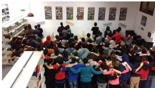
Los alumnos encerrados en la biblioteca

Un centenar de jóvenes están atrincherados para reivindicar formación gratuita en idiomas o baños multigénero