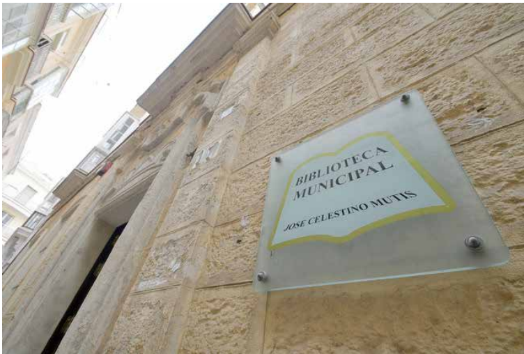
Fachada principal de la biblioteca Celestino Mutis de Cádiz.