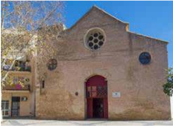
Fachada de Santa Lucía. J. J. Úbeda

tras la Fundación March y el propio archivo de la Biblioteca Nacional. Eso en cuanto a los libros, ámbito donde pueden encontrarse desde obras sobre hipnotismo hasta otras de mentalismo o fantasmas, porque en materia videográfica es el mayor fondo de toda España. Las donaciones privadas también van nutriendo el Fondo Andaluz de Ilusionismo; la última, de la Editorial Frakson que acaba de donar todos los libros y videos de su catálogo.