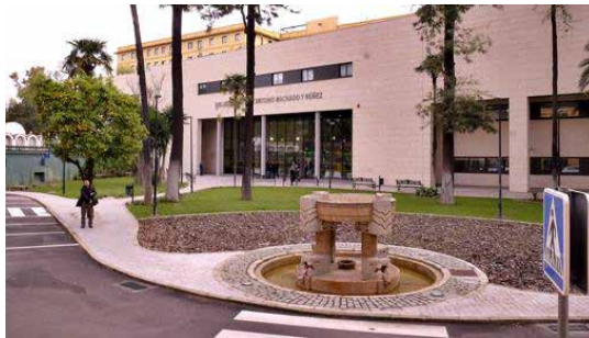
Vistas de la nueva biblioteca.