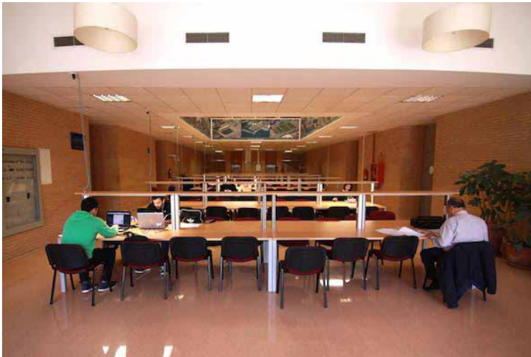
Sala de estudio de la Nicolás Salmerón de la UAL

Con la puesta a disposición de los estudiantes de un total de 135 PC, la medida supone una mayor autonomía para el alumnado y la dedicación del personal a tareas más cualificadas, a través de un nuevo servicio de información.