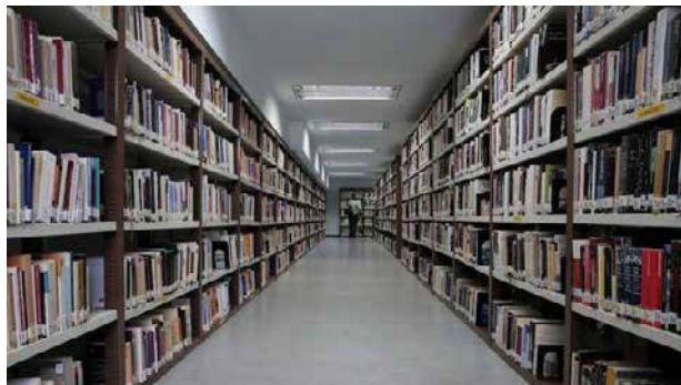
La Biblioteca Pública del Estado de Málaga cuenta con un catálogo que roza los 170.000 libros. Nito Salas