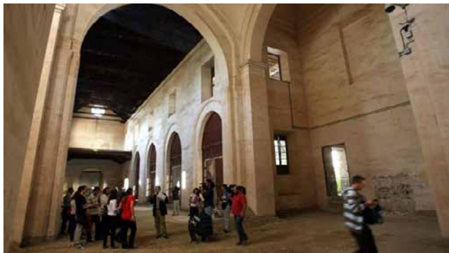
Interior del Convento de la Trinidad, cuyo destino vuelve a estar pendiente de concretarse. Carlos Moret

«Nuestro planteamiento es que se haga en San Agustín, con alguna actualización en el proyecto que se aprobó en su día», han confirmado a SUR fuentes del Gobierno. Desde el ministerio aluden al documento refrendado hace seis años que contempla una actuación por valor de 16,5 millones de euros en el inmueble situado junto a la iglesia de San Agustín y al Museo Picasso Málaga.